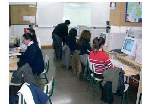
Aules equipades amb TV, vídeo i DVD.

Disponibilitat d'ordinadors (un per persona), connexió a Internet, realització dels treballs a l'escola, programes informàtics específics; Contaplus, Nominaplus, Office, Padre.