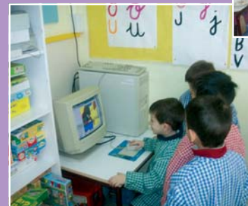
RACÓ DE L'ORDINADOR